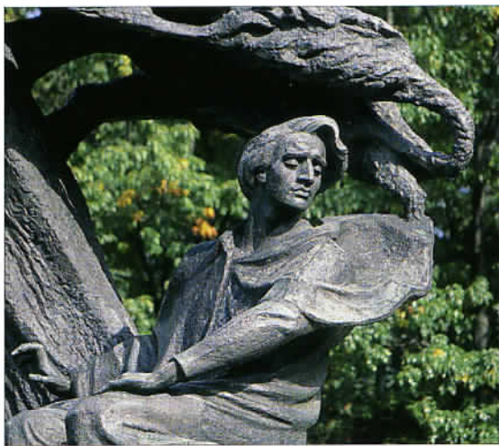
A l'entrée du célèbre parc Lazienki, le monument de Chopin accueille les Varsoviens.