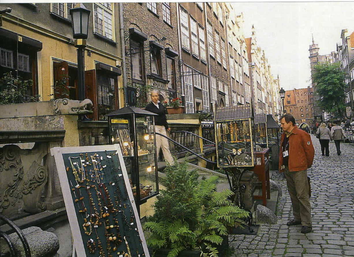
Lieu emblématique de Gdansk, la charmante rue Mariacka, méticuleusement reconstituée en 1970, est l'une des plus pittoresques de la ville.