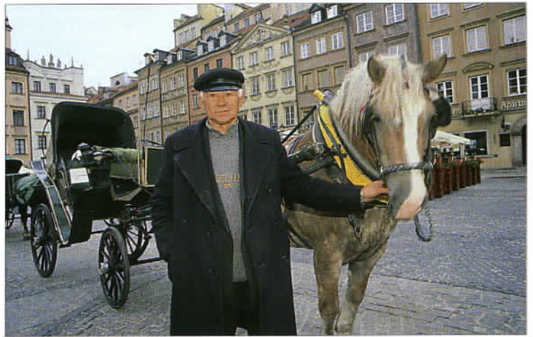
La place du marché de Varsovie est bordée de maisons chatoyantes, d'inspiration Renaissance et baroque.